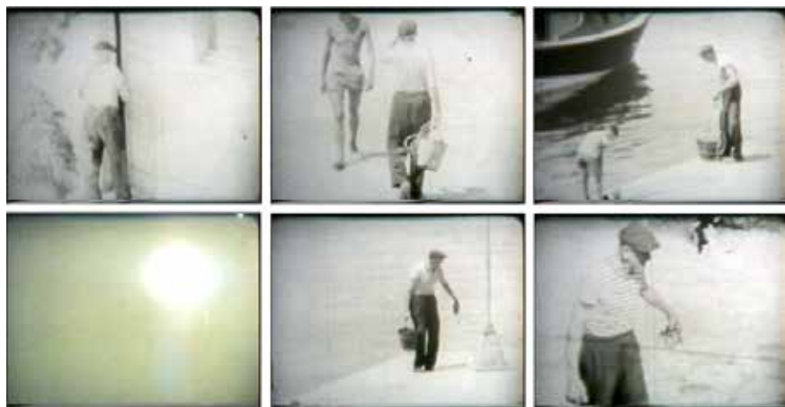
Slika 4. Zabod . Slijed kadrova – starčeva trasa od zahoda prema moru

Fiksacija – koja je već programatsko obilježje domaćeg eksperimentalnog filma (antifilma) – ovdje je također uhodilačka. Starac je promatran s distance: kadrovi su snimani s prozora/terase, a zahod se motri gornjim rakursom, iako smo time promatrački donekle ograničeni. Ne postoje prijelazi koji bi nas uvukli bliže, među zbivanja koja se odvijaju na vratima zahoda, gdje se povremeno zastaje, ponešto komentira. Naravno, takav jednoobrazni postupak (Turković 2009: 4) namjeren je i koliko god naizgled djelovao kao ograničenje, upravo se njime dobiva naglašeno iznijansirana meditacija ponavljanja, koju bi bilo kakvi naglašeniji izlagački postupci samo pokvarili.