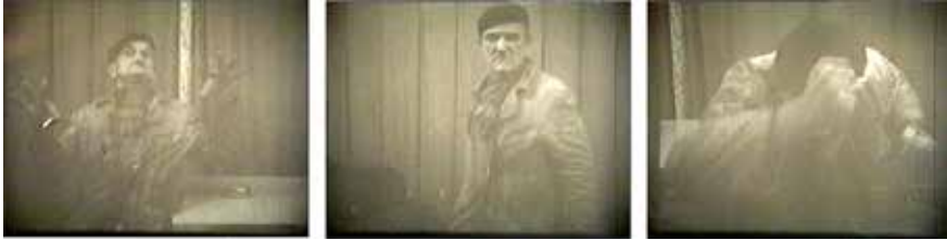
Slika 6. Plavi Jahač . Gospodin koji "glumi" pred kamerom

stavljenost i otvara pitanja. Zanimljivo je kako se ovdje, za razliku od prvoga dijela trilogije, tematizira prizorna pažnja : "kadriranje" je prvenstveno stvar odluke autora/snimatelja, a ne gledatelja.