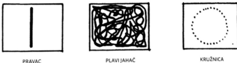
Slika 5. Gotovčev grafički prikaz filmske trilogije ( Pravac , Plavi jahač , Kružnica )

Gotovac je toj metodi dao jasan grafički prikaz: u trima kvadratićima jasno opisuje tri konceptualno postavljena postupka filmske trilogije.