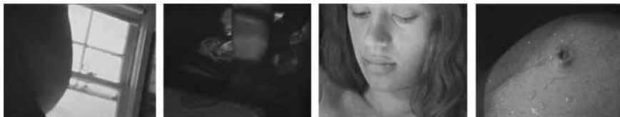
Slika 1. Prozor voda pomicanje bebe

Stilski, film se možda i ne razlikuje od prikazivačkih filmova kakve je Brakhage snimao u svojoj ranoj fazi, prije zaokreta prema protoapstraktnim ili apstraktnim filmovima, osobito sredinom pedesetih godina. No dok, primjerice, u filmu Put u vrt sjenki ( The Way to Shadow Garden , 1954), koji bi Sitney nazvao mitopoetskim (2002: 157–158), važnu ulogu ima upravo njegova vidljiva igrano -fiksijska razrada, gdje lik protagonista svojim djelovanjem ili "nedjelovanjem" nastoji komunicirati, predočiti stanja, film Prozor voda pomicanje bebe to čini ponajprije odnosom prema zatečenoj optičkoj situaciji – predočavanjem zbiljskog, spontanog događaja. Jasno, pitanje zatečenosti, objektivnosti/vjerodostojnosti, kao i same prirode nefikcionalnog filma danas obično vodi na sklisko teorijsko područje.